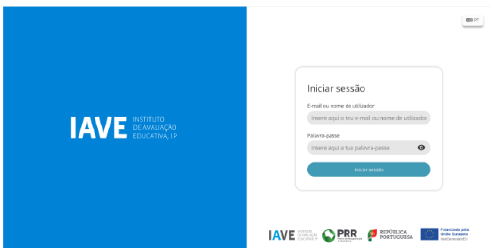
Acesso à Plataforma de Realização das Provas Eletrónicas do IAVE