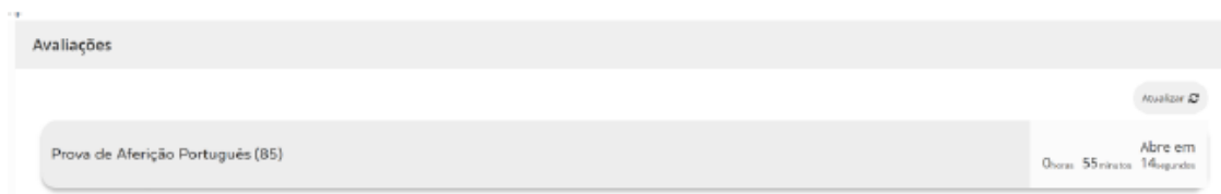
Acesso à prova a realizar

5.8. Ao clicar em “Iniciar sessão”, por exemplo, para um aluno que realiza a prova de aferição de Português (85), aparece o seguinte ecrã: